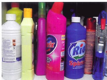
Afb. 2.5 Ook schoonmaakmiddelen kunnen gevaarlijke stoffen bevatten.

Dat is eigenlijk gek, want gevaarlijke stoffen kom je overal tegen. Denk alleen maar eens aan schoonmaakmiddelen. Of aan bestrijdingsmiddelen. Bestrijdingsmiddelen zijn gevaarlijke stoffen die in een afgesloten ruimte bewaard moeten worden. Alleen als je een spuitlicentie hebt, mag je ze gebruiken. En als je ze toepast, moet je beschermende kleding dragen. Ook mag je niet eten, drinken en roken tijdens het werk en moet je goed je handen wassen na afloop.