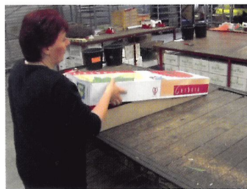
Afb. 2.12 Een juiste werkhoogte voorkomt dat je rug- en nekklachten krijgt.