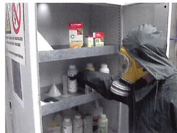
Afb. 2.7 Bestrijdingsmiddelen moeten in een afgesloten kast bewaard worden.

2.2 Wat betekent een pictogram met een doodskop?