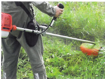
Afb. 2.2 Je mag pas met een bosmaaier of motorzaag werken als je 16 jaar of ouder bent.