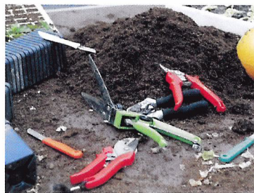
Afb. 2.3 Ga zorgvuldig om met je gereedschap. Laat het niet slingeren! Want dan kan er iemand over vallen.