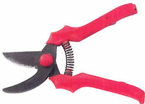
Afb. 2.8 Schoon gereedschap voorkomt verspreiding van bacteriën en virussen.