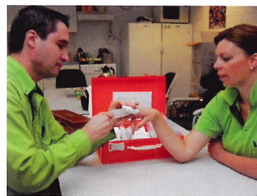
Afb. 2.4 Zorg dat er tijdens het werken met gereedschap een verbanddoos aanwezig is.