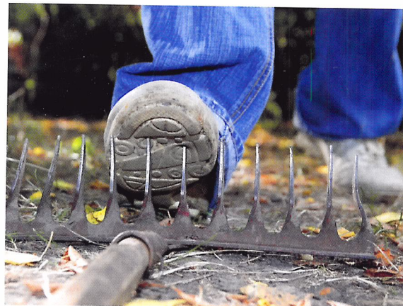
Afb. 2.1 Als je niet oplet, kun je jezelf voor het hoofd stoten.

Door goed op te letten, veiligheidsvoorschriften op te volgen en hygiënisch te werken, kunnen veel ongelukken worden voorkomen. Of je nu thuis werkt, in het praktijklokaal op school of op je stageplek.