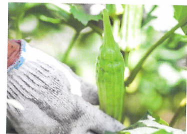
Afb. 2.10 Wanneer je handschoenen draagt, oogst je hygiënisch.