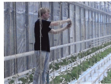
Afb. 2.13 Maak niet voortdurend dezelfde bewegingen.

2.4 wat is een voorbeeld van een belastende houding?